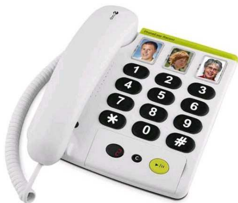
Doro PhoneEasy 331ph