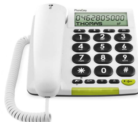
Doro PhoneEasy 312cs